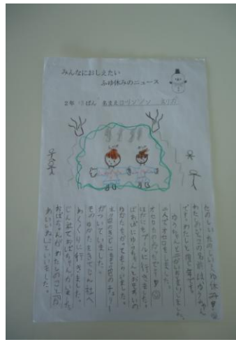
小二 リード海 ゴールドコーストマラソン 七月四日土曜日

ばあばに、ゆうちゃんとおそろいのゆかたをかってもらいました。水色のきじに、もも色のチェリーがついていました。そのゆかたをきて、じん社にわくぐりに行きました。 じん社におばちゃんがいました。おばちゃんが、わたしのこと「かわいいね。」といいました。