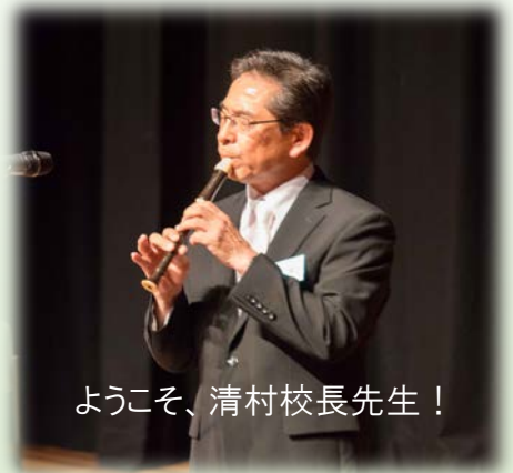
ようこそ、清村校長先生！