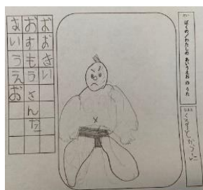
（クルート空虹さん）