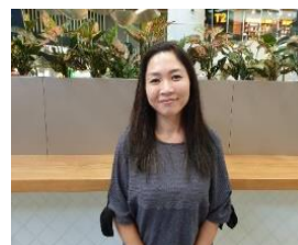
クイーンズランド日本語補習授業校 組織・運営

今までに保護者会会長を5年、役員を1年務めさせて頂きましたので保護者の中には私の事を知っていらっしゃる方がいるかも知れませんね。今は補習校始まって以来の大変な時期で保護者の方々も色々大変な事もあるかと思います。学校で皆さんとお会いする事もなかなか今は叶わない状態です。とりあえず、今は私ができる事を1つずつ先生方、運営委員、保護者会の皆さんと協力し合っこの状態を乗り切って行きたいと考えています。朝は、出来るだけ毎週お当番室に顔を出す予定です。これからお当番になる方、何か質問等ありましたら遠慮なく声をかけてください。最後になりますが1日も早く元の補習校生活に近づける様、運営委員一同力を尽くして参ります。いつもと違う事も多いかと思いますが、どうかご理解とご協力をお願い致します。